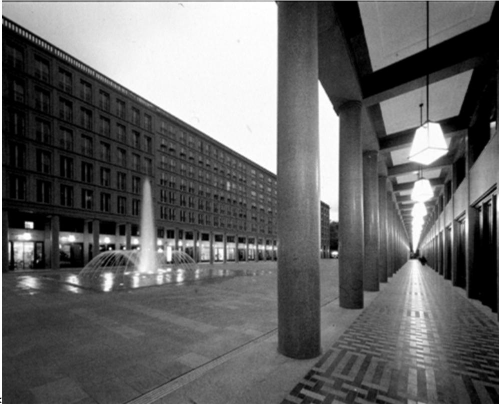
Abb. 5: Hans Kollhoff, Walter-Benjamin-Platz in Berlin, 1995-2001. Der Archetyp der Kolonnadenstraße ist hier zum Platz umgedeutet, tektonisch gegliederte Fassaden knüpfen an lokale klassizistische Stadtarchitektur an. (Kollhoff, Hans, Architektur, München 2002)

Barcelona nach den Plänen von Oriol Bohigas ab 1980 ist ein weiteres führendes Beispiel der stadtkonformen Modernisierung.[34] Je nach Ort war hier die Strategie unterschiedlich: Erweiterungen folgten dem Modell des reformierten Blocks auf der Basis von Ildefonso Cerdàs historischem Plan, die mittelalterliche Innenstadt wurde vor allem durch das Einfügen neuer Plätze aufgewertet, womit zugleich die hygienischen Wohnbedingungen und der öffentliche Raum verbessert wurden. Auch Paris erlebte in den 1980er Jahren die Rückkehr zur traditionellen Stadt: Neue Wohnquartiere wie etwa in Bercy folgten der Typologie des städtischen Blocks, neue öffentliche Monumente wie die Grands Projets von François Mitterrand markierten entscheidende Punkte des bestehenden Stadtnetzes.[35] Alle diese europäischen Projekte – zumeist von sozialistischen Regierungen initiiert – zielten auf eine Erneuerung der städtischen Kultur und des Bürgersinns durch die Einbeziehung unterschiedlicher sozialer Gruppen und Schichten, die Definition