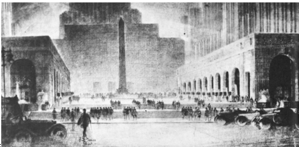
Abb. 3: Harvey Wiley Corbett, Entwurf für das Metropolitan Opera House (später Rockefeller Center) in New York, 1928. Flankierende Arkaden sollen einen Platz schaffen, der Michelangelos Kapitol in die moderne Hochhausstadt übersetzt. (Balfour, Alan, Rockefeller Center. Architecture as Theatre, New York 1978)

Diesem Produkt kapitalistischer Spekulation lassen sich europäische Beispiele entgegenstellen, die ähnliches mit sozialistischem Hintergrund erreichten. Geradezu einen Urbanisierungssprung stellte die Errichtung von Les Gratte-Ciels (1930) als neuem Zentrum von Villeurbanne dar. [20] Hochhäuser mit Wohnungen und Geschäften säumten einen zentralen Boulevard, Hochhäuser markierten die Fluchtpunkte, ein Arbeiterpalast dominierte den öffentlichen Platz – all dies urbanisierte und monumentalisierte die proletarische Peripherie Lyons. Voller politischer Repräsentationsabsichten steckte Stalins Projekt zur Errichtung von Hochhäusern als Kranz um die neue Stadtkrone des turmartigen Sowjetpalastes (1949). [21] Diese Bauten besetzten nicht nur sinnvolle Orte im Gesamtplan der Stadt, sondern integrierten sich mit ihren unterschiedlichen Funktionen, ihrer städtebaulichen Ausrichtung auf Straßen und Plätze sowie mit ihrem Stil in die bestehende Großstadt. Wenn sie auch vom Sieg des Sozialismus über den Klassenfeind künden sollten, so folgten sie doch gerade Beispielen der kapitalistischen Bauproduktion in New York und zeigen einmal mehr, dass städtische und architektonische Formen nicht in den politischen Ambitionen ihrer Auftraggeber aufgehen müssen.