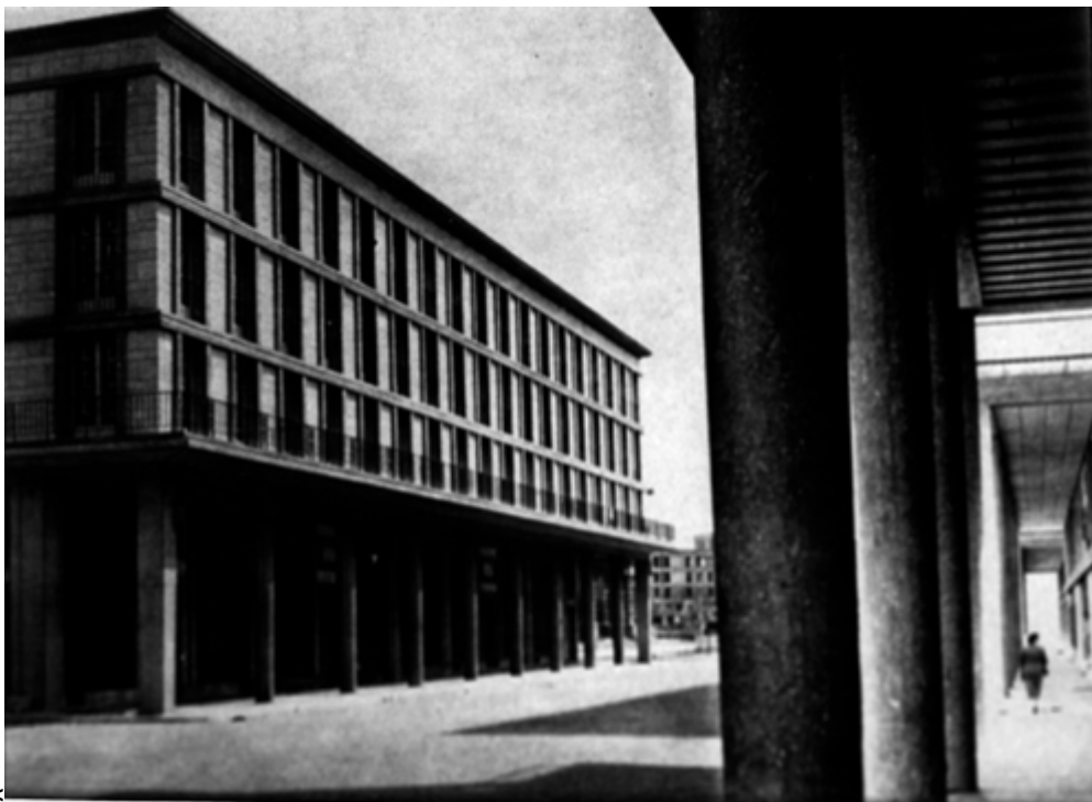
Abb. 4: Auguste Perret, Rue de Paris in Le Havre, 1945-50. Kolonnaden und tektonisch gegliederte Fassaden formen eine modernisierte Version des französischen Klassizismus und der Rue de Rivoli in Stahlbeton. (Abram, Joseph u.a. [Hgg.], Les frères Perret. L'oeuvre complète, Paris